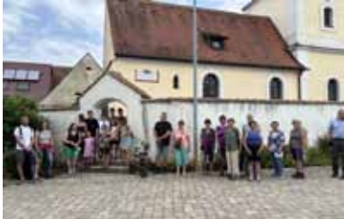
Die Wallfahrer vor der Halsbacher Kirche

Abmarsch der Wallfahrer war vor der Halsbacher Kirche. Nachdem es erst nur geträpelt hatte, mussten wir uns nach einem stärkeren Regenguss beim Halsbacher Feuerwehrhaus gleich mal unterstellen. Danach meinte es das Wetter aber gut mit uns und wir, 27 Wallfahrer, konnten uns bei bestem Wetter Richtung Villersbronn auf den Weg machen.