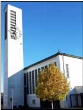
St. Ulrich und Afra Feuchtwangen

DER KATHOLISCHEN PFARREIENGEMEINSCHAFT FEUCHTWANGEN - DÜRRWANGEN