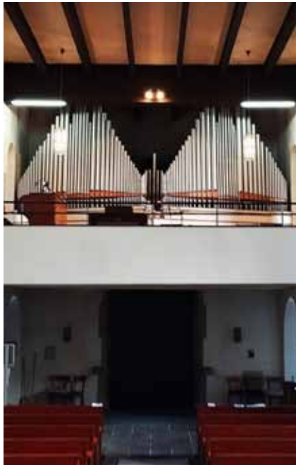
St. Raphael, Großohrenbronn: