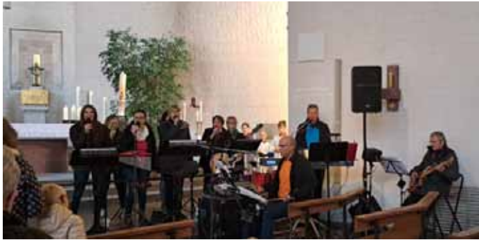
Band SCS in der Pfarrkirche St. Ulrich und Afra

Die Band hat sich dem Neuen geistlichen Lied verschrieben und singt und spielt bei Gottesdiensten aller Art, bei Jugendgottesdiensten, bei kirchlichen Trauungen, Firmungen, Open-Air Gottesdiensten usw.