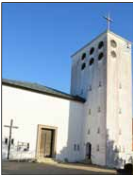
St. Raphael Großohrenbronn

„Christus wurde in Betlehem geboren, das ist eine wunderbare geschichtliche Tatsache. Aber es ist eine Tatsache, die abgeschlossen ist.