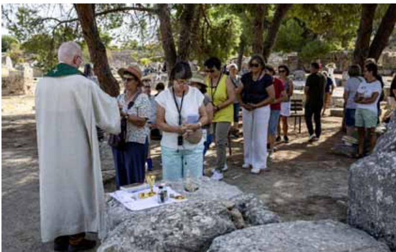
Freiluftgottesdienst an der Ausgrabungsstätte „Alt-Korinth“