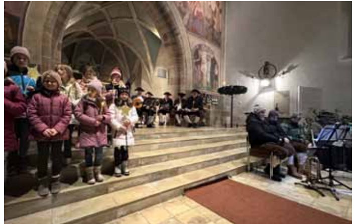
Adventskonzert 2024 in der Pfarrkirche Maria Immaculata