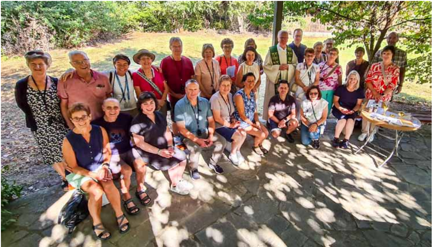
Unsere Reisegruppe an der Taufstelle der Lydia im antiken Philippi