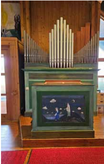
Hl. Kreuz, Wittelshofen