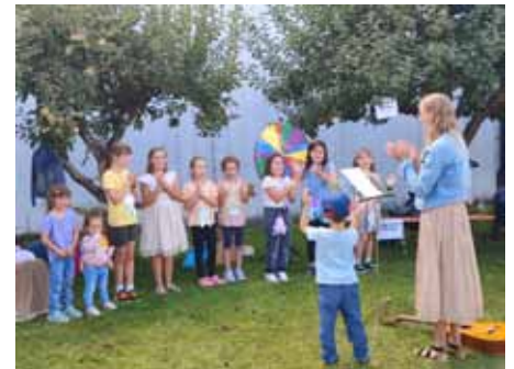
Feriensingstunde, Auftritt beim Pfarrfest

Beim Pfarrfest in Großohrenbronn traten die Kinder zum ersten Mal auf und präsentierten ihre Lieder. Ein weiterer Auftritt folgte beim Familiengottesdienst in der evangelischen Kirche in Dentlein, den sie musikalisch mitgestalteten.