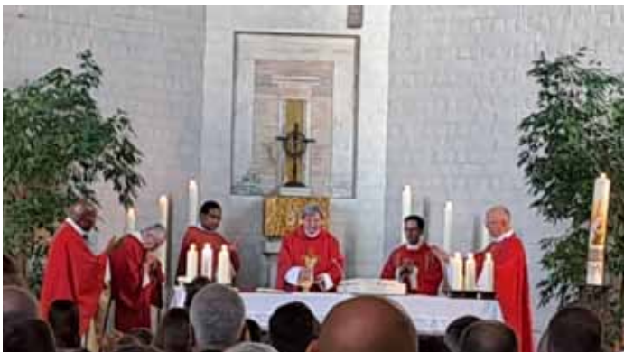
Feierlicher Firmgottesdienst in St. Ulrich und Afra

In seiner Ansprache ermutigte er die Firmlinge, ein mutiges Glaubenszeugnis abzulegen, das auf dem festen Fundament der Treue und Liebe Gottes, wie sie sich in Jesus Christus offenbart haben, und der ständigen Erneuerung durch die Kraft des Heiligen Geistes gebaut ist.