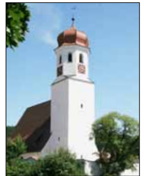
St. Peter und Paul Halsbach