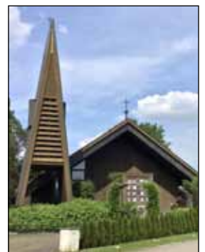
Heilig Kreuz Wittelshofen