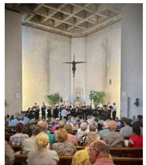
Der Kammerchor in St Ulrich und Afra

Danke an alle, die diesen Abend möglich gemacht haben!