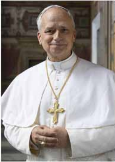
Leo PP. XIV

Seit dem 8. Mai 2025 ist Robert Prevost Bischof von Rom und Papst der katholischen Kirche. Auch wenn er am Tag seiner Wahl für viele noch unbekannt war, konnte er bereits auf einen erfolgreichen Lebenslauf zurückblicken.