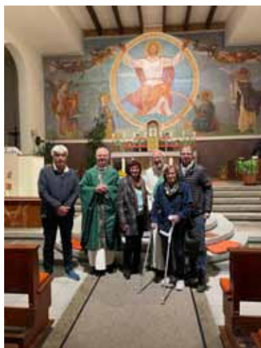
Gruppenbild nach dem Verabschiedungsgottesdienst