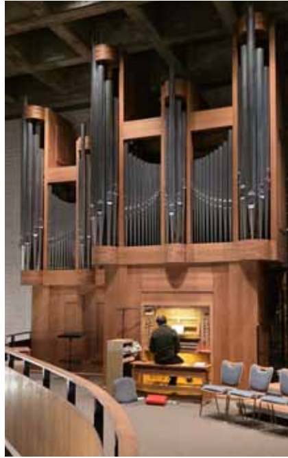
St. Ulrich und Afra - Feuchtwangen:

Die neue Feuchtwanger Orgel ersetzte das seit kurz nach dem Bau der Kirche im Jahr 1960 als Provisorium gedachte Werk. Sie wurde 1997/1998 als opus 1056 der Orgelbaufirma Link im massiven Eichenholzgehäuse erbaut und am 26. April 1998 eingeweiht. Die Bauzeit betrug ca. 5500 Stunden. Das Instrument verfügt über 27 Register, die kleinste Orgelpfeife misst ca. 9 mm, die größte 3,70 m Länge.