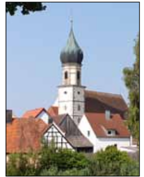
Maria Immaculata Dürrwangen