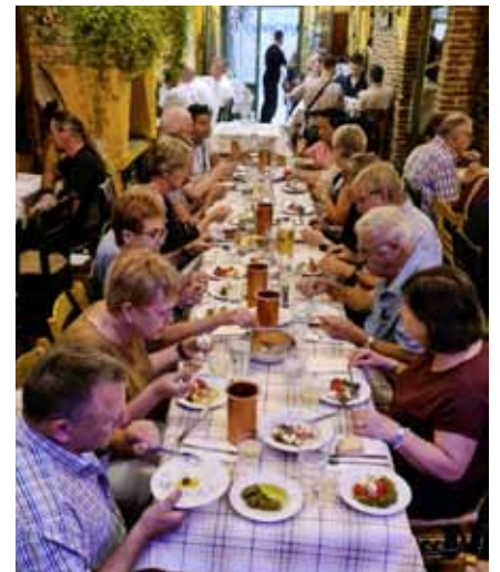
Gutes griechisches Essen