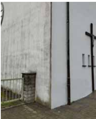
Renovierte und nicht renovierte Seite der Kirchenfassade.

Dennoch wurde in diesem Jahr der zweite Bauabschnitt in Angriff genommen, da sich die Rahmenbedingungen in der Diözese verbessert haben. Alle Baumaßnahmen mit Kosten unter 100.000 € können mit weitaus geringerem Verwaltungsaufwand durchgeführt werden. So ist beispielsweise kein Architekt mehr zur Objektbetreuung nötig, Gutachten zu einzelnen Gewerken können entfallen und es gilt ein vereinfachtes Ausschreibungsverfahren in Eigenverantwortung der Pfarrei. Dadurch kann der Ablauf des Verfahrens beschleunigt und die Kosten reduziert werden.