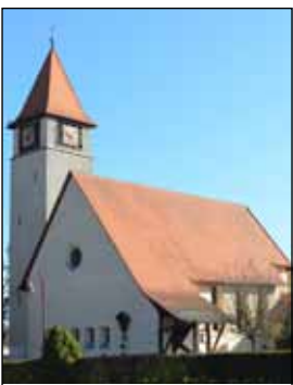
St. Bonifatius Schnelldorf