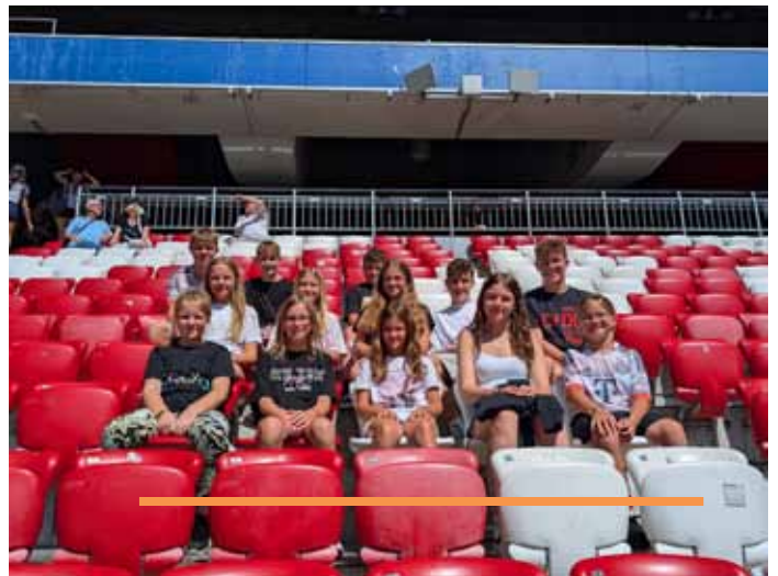
Die Halsbacher Ministranten in der Allianz Arena.

Abends gab es traditionell Spaghetti mit Hackfleischsoße. Danach saßen wir am Lagerfeuer, knisternde Flammen, Stockbrot, Marshmallows, Spiele und Musik – perfekte Stimmung.