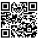
St. Peter und Paul

Direkt zu den Gottesdienstterminen der Pfarreien gelangen sie über die QR-Codes