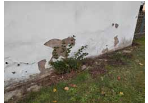
Putzschäden an der Ostfassade.

Zur Kostenermittlung wurden bereits im Juni Kostenvorschläge für die Putz- und Streicharbeiten eingeholt. Diese hielten sich in einem erfreulichen