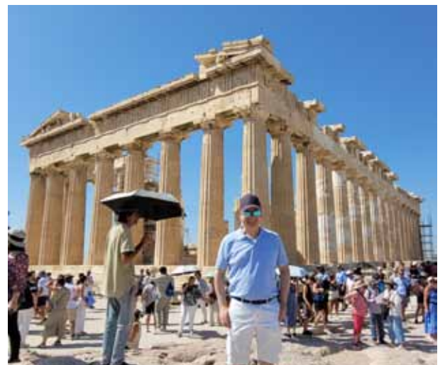
Parthenon auf der Akropolis